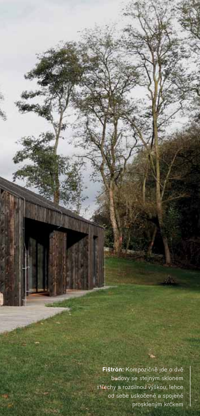
Fištrón: Kompozičně jde o dvě budovy se stejným sklonem střechy a rozdílnou výškou, lehce od sebe uskočené a spojené proskleným krčkem