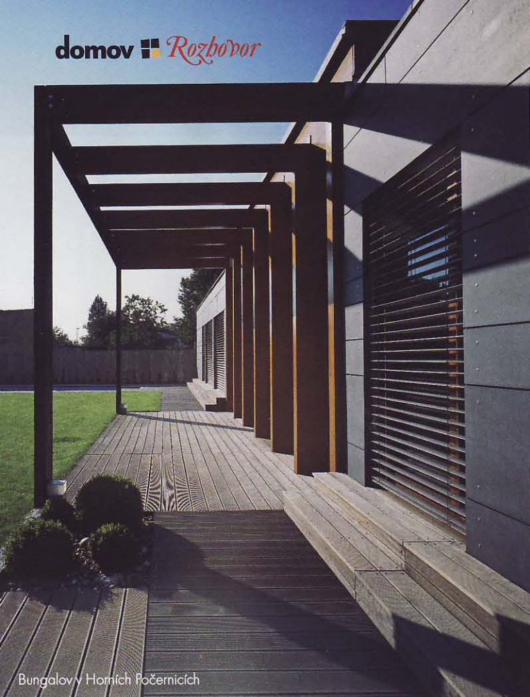
Bungalovy Horních Počernicích