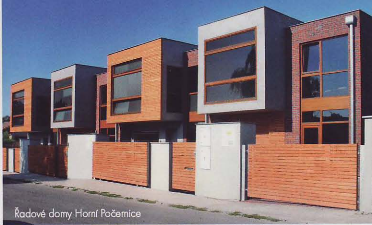
Řadové domy Horní Počernice