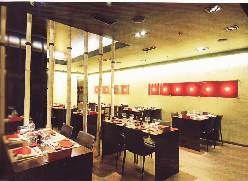
Skleničky na víno a hůlky, bambusové kmeny na jatobových parketách – tato kombinace vytváří globálně-japonský šarm restaurace.